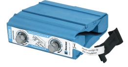
Wedge ja Wedgekit